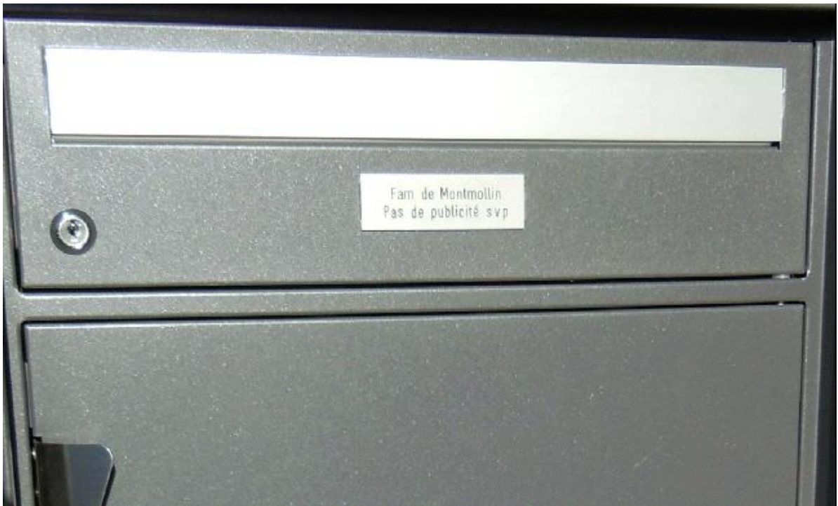
Boîte-à-lettres de l'individu