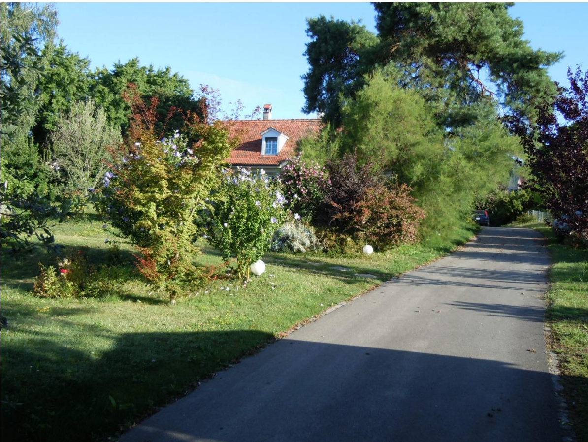
Villa DE MONTMOLLIN sur les rivages du lac Léman – façade sud